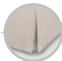
Finitura a balza volant (solo per la versione Square)