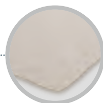
Finitura a caduta (solo per la versione Square)