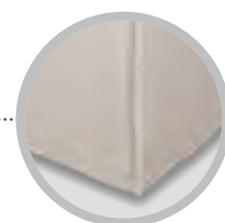
Finitura reverse (solo per la versione Square)