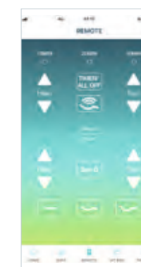
Schermata App Sleep Assist